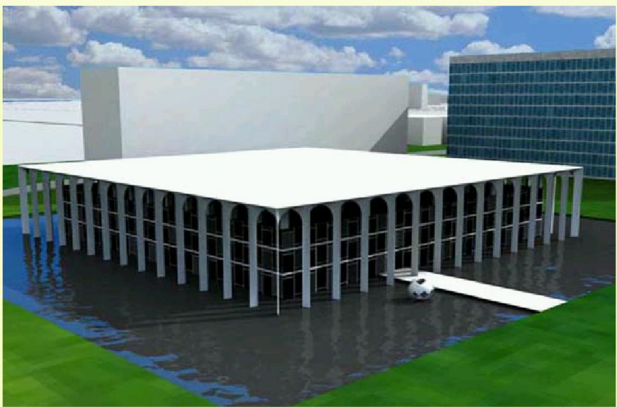
BOSQUE ARQUITECTÓNICO ●●●●●●●●