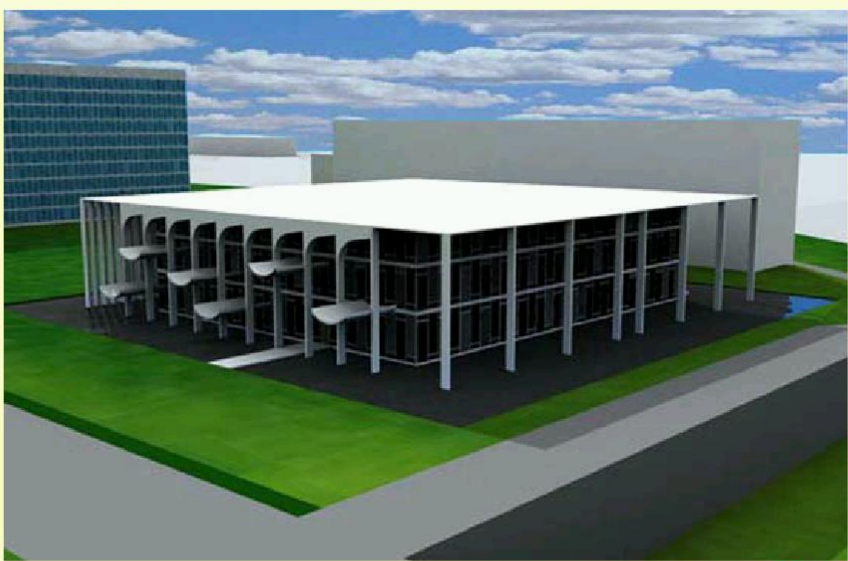
EDIFICIO CASCADA ●●●●●